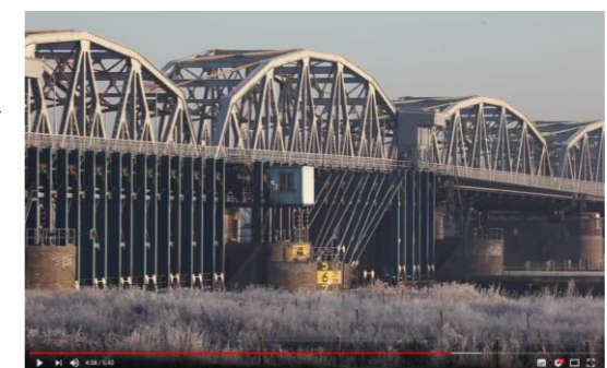
Video gemaakt door Onderzoeksraad naar aanleiding van het incident